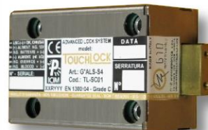
SERRATURA MECCATRONICA AUTO-DECISIONALE