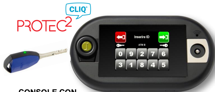
CONSOLE CON DISPLAY TOUCH, DALLAS E SERRATURA CLIQ ABLOY